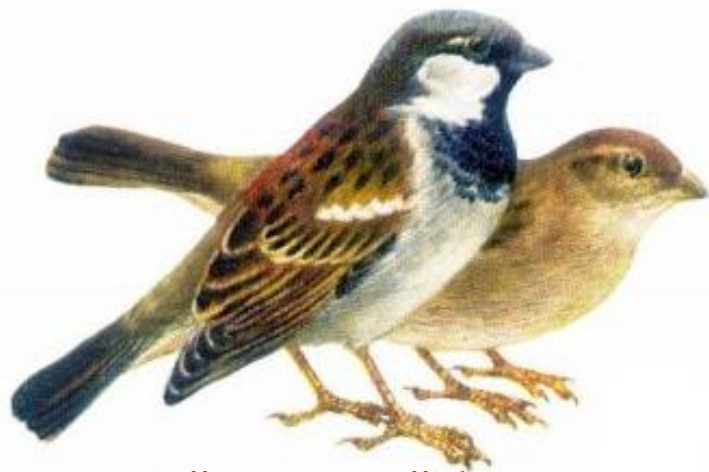
Воробей домовый (самец и самка)