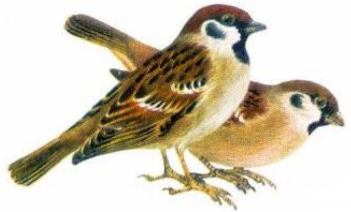
Воробей полевой (самец и самка)

У полевого и домового воробьев имеются различия: у самца домового воробья верх головы серый, а оперение самки более или менее однотонное; у полевого воробья, как у самца, так и у самки, «шапочка» коричневая, а на светлых щеках хорошо заметное на расстоянии темное пятно.