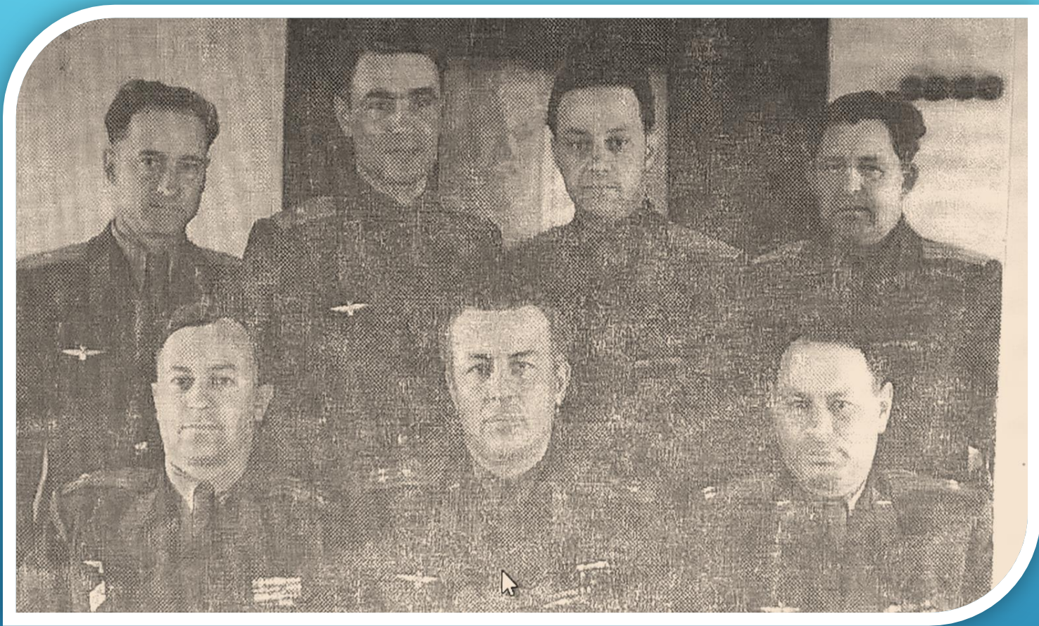
ШТУРМАНСКИЙ ОТДЕЛ ШТАБА 29 ВЗВОДА АРМИИ. О. САХАЛИН.