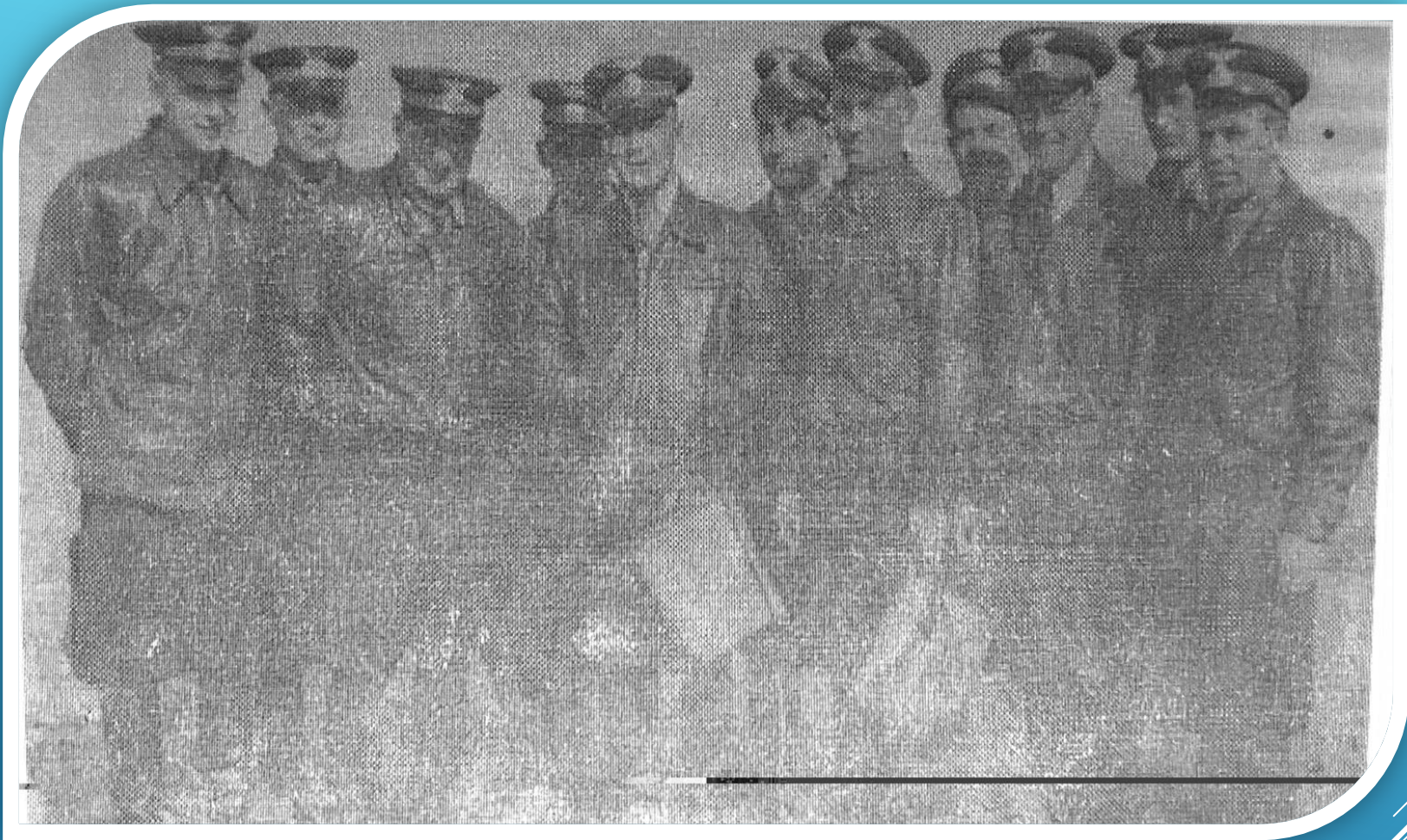
НА АЭРОДРОМЕ ЛЁТНЫЙ СОСТАВ 349 АВИАПОЛКА.